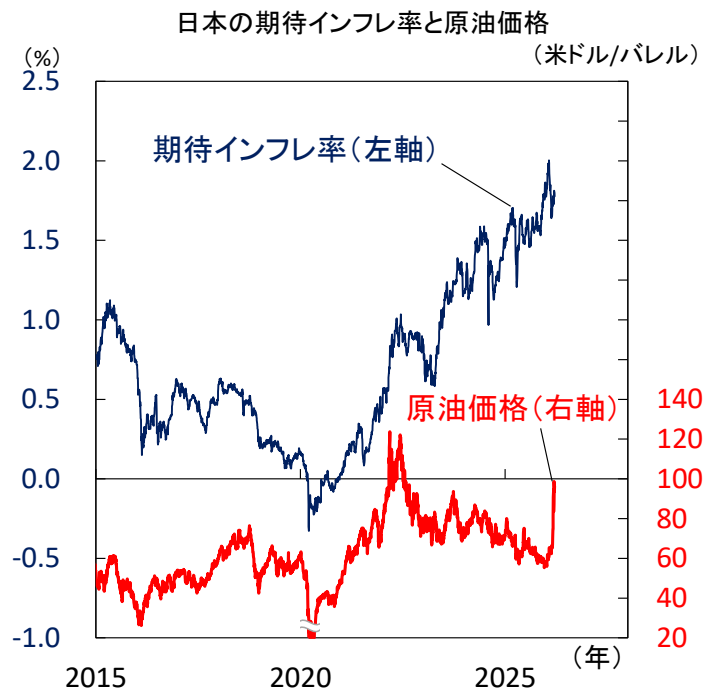
【図2】 原油価格動向の不確実性が高まるなか、日銀は様子見姿勢を強めるのか、植田総裁の会見に注目

注) ここでのインフレ率はブレイクイーブン・インフレ率（10年債ベース）。直近値は2026年3月18日。